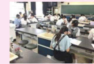
小学生学習支援ボランティア（ジョトスタ）