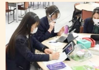
全国高校生フォーラム（文部科学省）