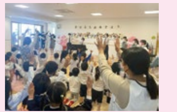
音楽交流会（グリーン長利こども園）