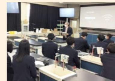
岡山大学教授による指導助言