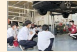
企業訪問（岡山トヨタ）