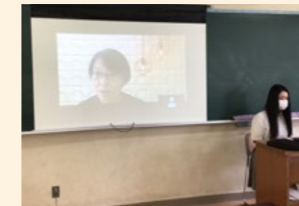
課題研究最終発表