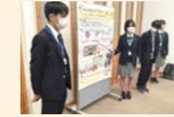
Well-being フォーラム （県教育委員会）