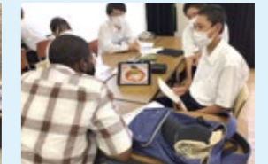
岡山大学留学生との交流