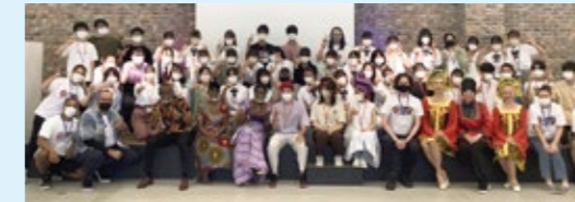
FLAT in Osaka