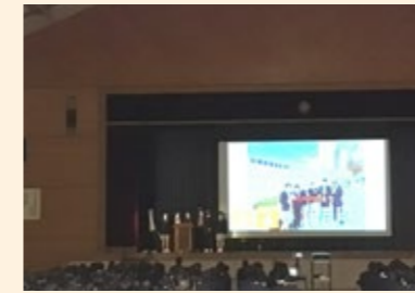
課題研究・体育館発表