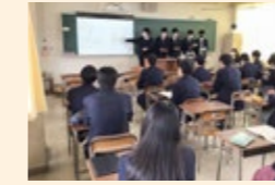
課題研究・教室発表